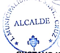
GUSTAVO WILLIAM AREVALO CORNEJO Alcalde