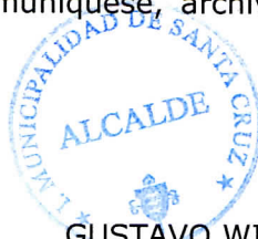
GUSTAVO WILLIAM ARÉVALO CORNEJO Alcalde