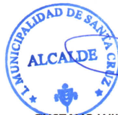
GUSTAVO WILLIAM ARÉVALO CORNEJO Alcalde