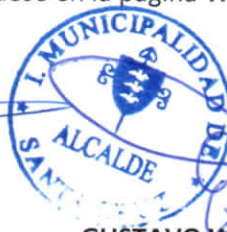
GUSTAVO WILLIAM AREVALO CORNEJO Alcalde