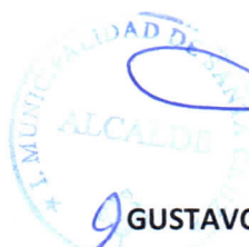
GUSTAVO WILLIAM ARÉVALO CORNEJO Alcalde