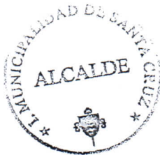
GUSTAVO WILLIAM ARÉVALO CORNEJO Alcalde